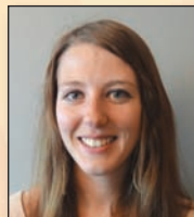
Sara Medi Ymchwilydd

ASP 8H153 European Parliament 1047 Bruxelles jill.evans-office@ europarl.europa.eu T 00322 2847103 F 00322 2849103